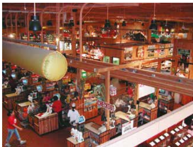
Pohled „okem kamery“ na pokladní prostor obchodu Stew Leonard's v Newingtonu, Connecticut. Obchod je vybaven 126 kamerami s nepřetržitým záznamem.